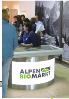
Kassentisch: xxxx € pro Tisch inkl. Stuhl