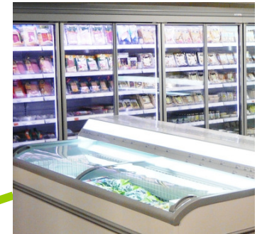
Kühlmöbel: Mopro-Regal ca. xxxx € / lfm TK-Truhe ca.