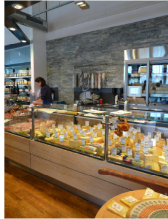
Käse-/Wursttheke: xxxx € pro lfm je nach Ausführung