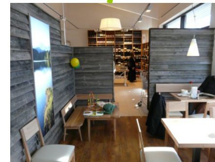
Bistro-Bereich: ca. xxxxx € - xxxxx €