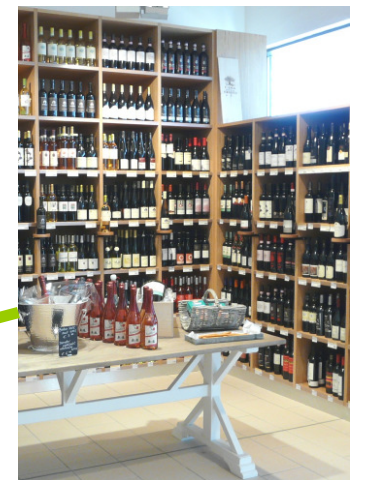
Weinregal: ca. xxxxx € - xxxxx € pro lfm