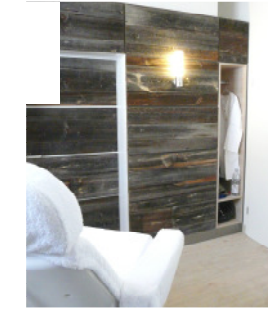
Kosmetikraum: xxxx € pro qm je nach Ausstattung