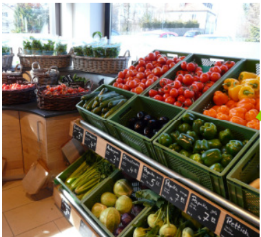
Obst/Gemüse-Bereich: ca. xxxxx € - xxxxx € Pavillon mit Kühlung: ca. xxxxx € - xxxxx € je nach Größe