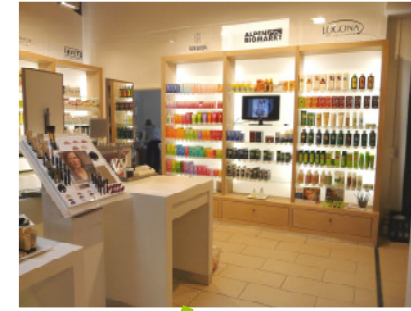
Kosmetik: Kosmetik-Regal ca. xxxx € / lfm Aktionstische