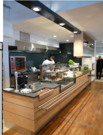
Bedienbereich: xxxx € je nach Ausführung