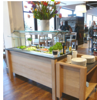
Saladette: ca. xxxxx € - xxxxx €