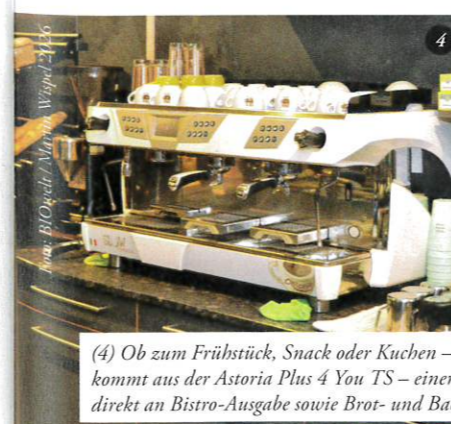
(4) Ob zum Frühstück, Snack oder Kuchen – der fair gehandelte, langzeitgeröstete Bio-Kaffee (San Vicario Ora) kommt aus der Astoria Plus 4 You TS – einer echten Profimaschine. (5) Eine kleine, aber feine Käsetheke schließt direkt an Bistro-Ausgabe sowie Brot- und Backwaren an.