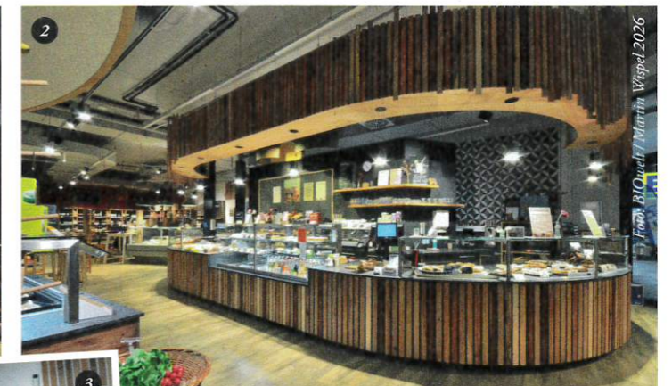
(1-2) Vom Eingangsbereich aus blicken die Kunden im Bioritter unmittelbar auf die holzverkleidete Bedienteheke. (3) Zahlreiche Sitzgelegenheiten finden sich auf der gesamten Verkaufsfläche verteilt.